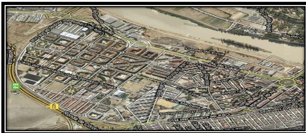
Calle Torremolinos y Barrio del Guadalquivir.