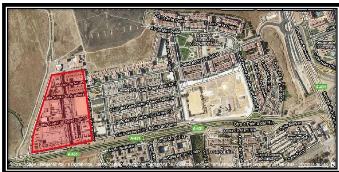
Barrio de las Palmeras.

El Barrio de las Palmeras se encuentra situado en el distrito noroeste (Distrito-6) de Córdoba, en la carretera de Palma del Río, en la periferia de la ciudad. Actualmente, y debido a la expansión territorial de Córdoba, esta zona se ha incluido dentro del distrito Poniente Norte.